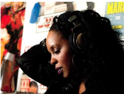
【MC 饒舌 | 講師：Rah Digga】

Rashia Tashan Fisher (藝名：Rah Digga) 是一名美國饒舌歌手兼演員。她曾是由饒舌歌手 Busta Rhymes 領軍的 Flipmode Squad 嘻哈組合的老班底，以此身分最為歌迷所樂道。Rah Digga 的出道專輯《Dirty Harriet》(2000年)曾在 Billboard 200 強榜單衝上前 20，第二張專輯《Classic》則在 2010 年發行。此外，Rah Digga 還曾在 2001 年上映的恐怖電影《惡靈 13》(Thirteen Ghosts) 飾演 Maggie 一角。